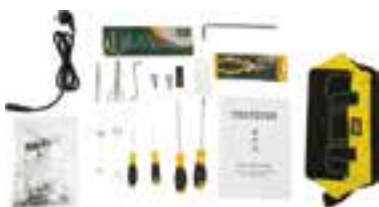
kit di strumenti

Kit di strumenti Manuale operativo Tavolo e supporto con ruote Bobinatore