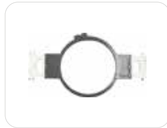
1 x telaio rotondo 12cm