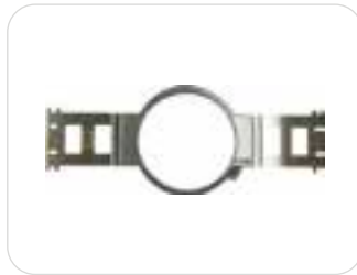
1 x telaio rotondo 15cm