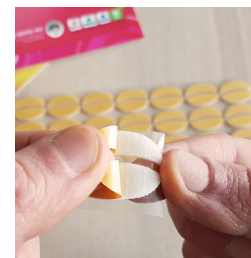
TWO TACK® JELLY