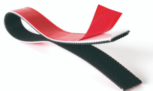
REVERSO - BLACK STRAP