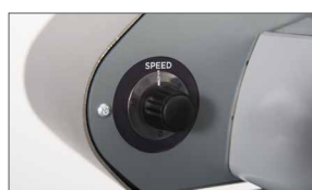
Regolatore della velocità di taglio (max. 100 m/min.)