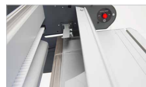
Pressino con discesa automatica per il bloccaggio del materiale da tagliare