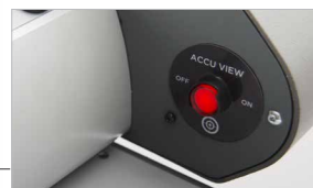
Sistema di taglio preciso "Accu View"