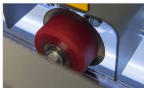
Lama rotativa auto-affilante per affidabilità a lungo termine senza costi di manutenzione