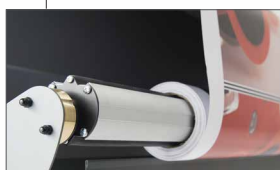
Albero svolgitoro anteriore per il taglio da rotolo a foglio (optional)