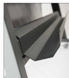
Vasca di raccolta delle stampe (optional)