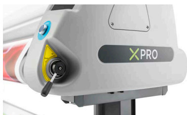
Sollevamento/abbassamento pneumatico del rullo tramite leva