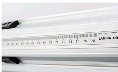
Scala millimetrata sugli alberi per il corretto posizionamento del materiale