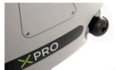
Pressione della laminazione regolabile