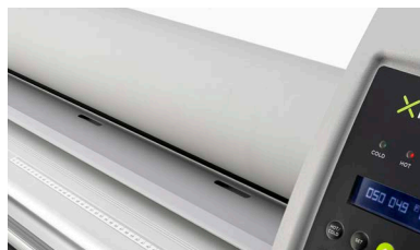
Rulli in silicone antiadesivi