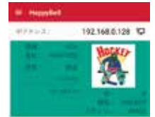
HAPPY BELL Applicazione per dispositivi mobili per monitorare lo stato della macchina LAN/LINK