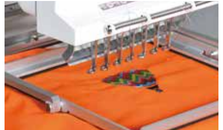
Manual Clamping Frame (Large:150x300mm Small:150x150mm)