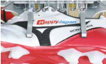
Telaio scarpa - Shoe Clamp (60x100mm)