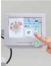
Pannello Touch 999 disegni in memoria 40,000,000 punti di memoria