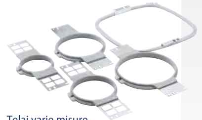
Telai varie misure