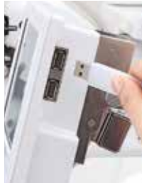
Mouse e USB