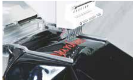
Side Clamp (140x220mm)