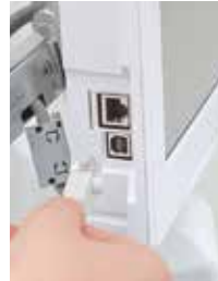
Connessione LAN / USB / WIFI