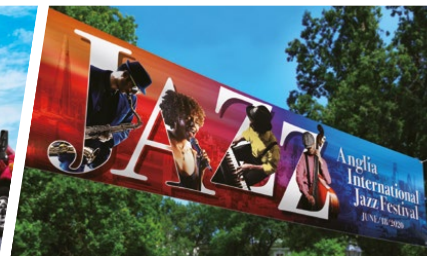
BANNER, INSEGNE E POSTER