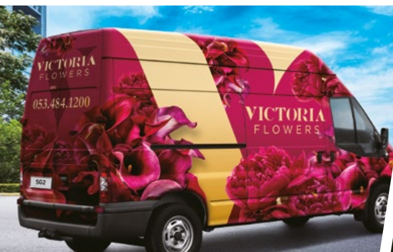
WRAPPING PER VEICOLI