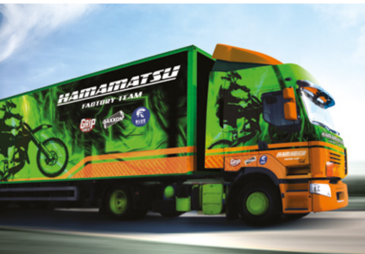
WRAPPING DI VEICOLI